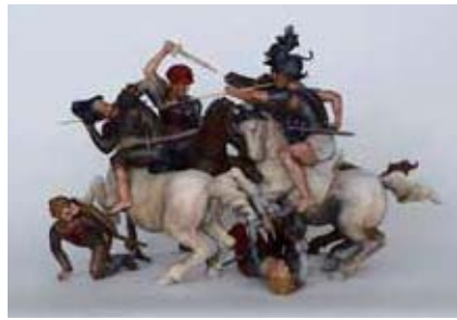
1. 作者不詳(レオナルド・ダ・ヴィンチに基づく)《タヴォラ・ドーリア》(《アンギアーリの戦い》の軍旗争奪場面) フィレンツェ、ウフィツィ美術館(東京富士美術館より寄贈) Ex S.S.P.S.A.E e per il Polo Museale della città di Firenze-Gabinetto Fotografico | 2. アリストテイル・ダ・サンガッロ(本名 バスティアーノ・ダ・サンガッロ)《カッシナの戦い》(ミケランジェロの下絵による模写) ホウカム・ホール、レスター伯爵コレクション © Collection of the Earl of Leicester, Holkham Hall, Norfolk By kind permission of Lord Leicester and the Trustees of Holkham Estate | 3. レオナルド・ダ・ヴィンチの工房、伝ジャン・ジャコモ・カプロッチェ(通称: サライ)《聖アンナと聖母子》 ロサンゼルス、ハマー美術館 Collection University of California, Los Angeles. Hammer Museum. Willits J. Hole Art Collection. | 4. ピーテル・パウル・ルーベンスに帰属(レオナルド・ダ・ヴィンチに基づく)《アンギアーリの戦い》 ウィーン美術アカデミー絵画館 Gemäldegalerie der Akademie der bildenden Künste Wien | 5. 本木諒、井田大介、布山浩司、大石雪野、横川寛人、宮田将寛《タヴォラ・ドーリア》の立体復元彫刻 東京富士美術館 © Tokyo Fuji Art Museum

レオナルド・ダ・ヴィンチの未完の大壁画制作計画「アンギアーリの戦い」は、今も多くの謎と痕跡を残しています。同壁画はイタリア・ルネサンス美術の歴史の中でも、最も野心的な装飾計画のひとつです。シニョリーア宮殿(現ヴェッキオ宮殿)を舞台にレオナルドとミケランジェロが戦闘画において競演したエピソードは大変有名ですが、その計画の全貌はまだまだ明らかにされていません。