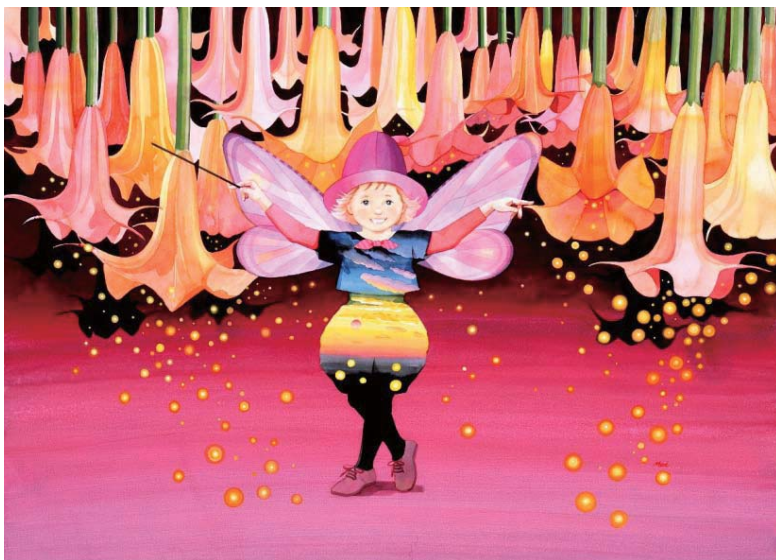
《夕焼け色のコンチェルト》2011年 アクリル、ガッシュ

絹地に友禅技法で描かれた椿。フランスで展示した際に、フランスでは落ちた花は描く対象にならない(のにその落ちた椿を描いている)と話題になったとか。