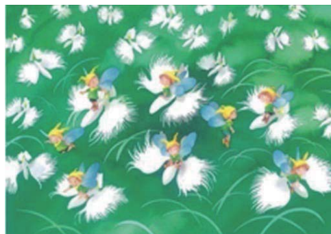
《野原の遊園地》 1994年 カラーインク