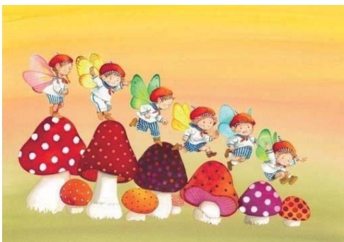
《キュンキュンきのこ組》 2008年 カラーインク

作者はイラストレーターとしてだけではなく、自身が文と絵を制作したオリジナル絵本や絵本の挿絵も描いています。このパートでは、最新のオリジナル・ストーリーである『クリコさんと笑わないクマ』全原画をはじめ、『マッチ売りの少女』や『ふしぎの国のアリス』などさまざまな絵本の仕事も紹介します。