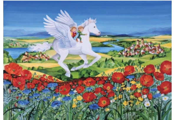
《風の翼》2012年 アクリル、ガッシュ

アクリル絵具は1940年代以降にアメリカで開発が進められた絵具。溶剤にアクリル樹脂を使ったもので、乾燥が他の絵具よりも早く、乾くと耐水性となります。永田が使用する液状のアクリル絵具＝リキテックス・リキッドは、2009年にリキテックス社が販売開始した新しい画材です。カラーインク作品よりも大画面に描かれた力強い色彩の迫力をお楽しみください。