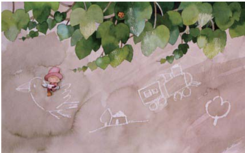
《白いらくがき》1978年 カラーインク

締切を迎えてもアイデアが浮かばなくなってしまった作者が、夢の中で見た絵を描いたというのがこの作品。初期の作品のなかでもユニークなエピソードを持っています。