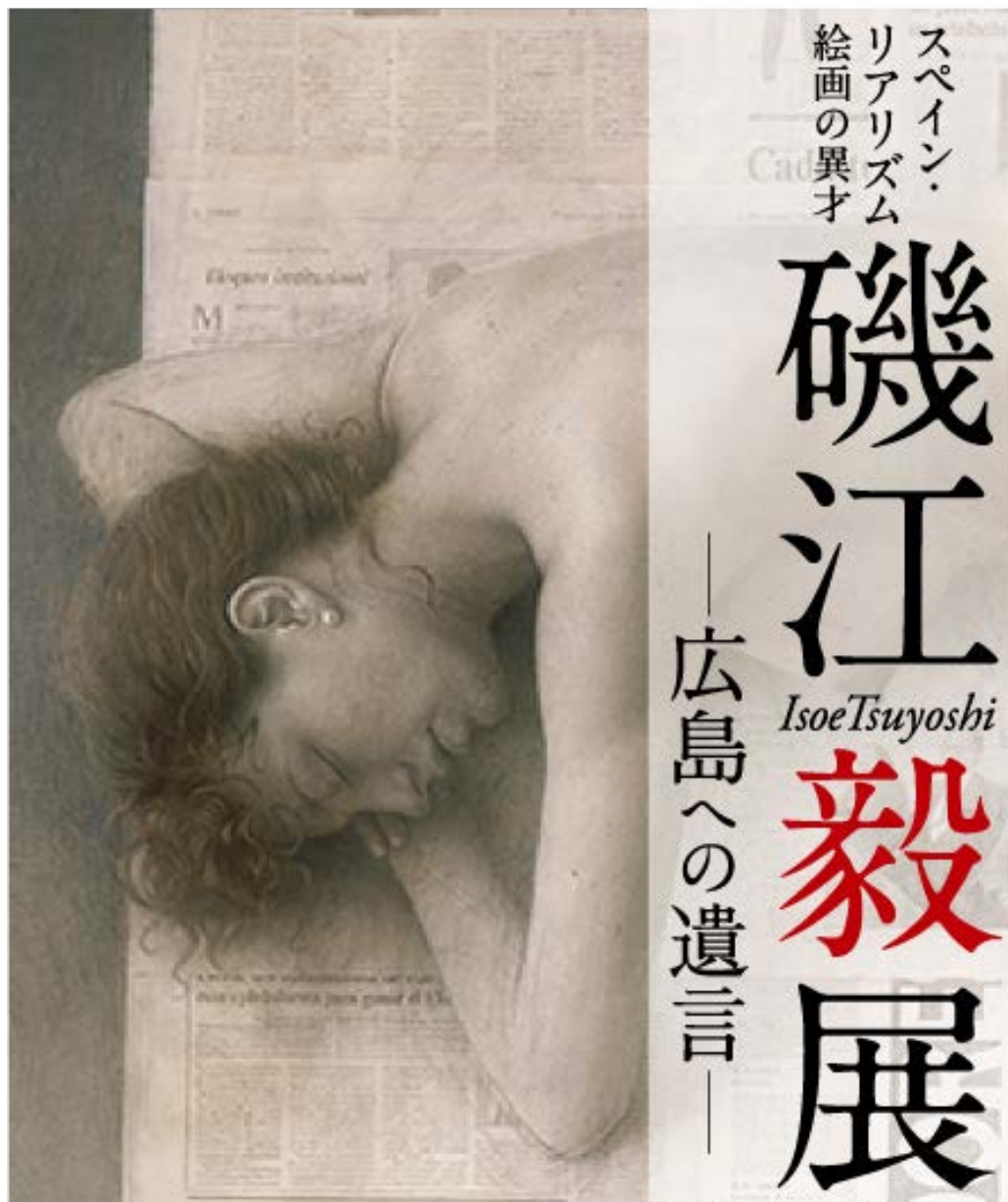
磯江毅《新聞紙の上の裸婦》(部分) 1993-94年