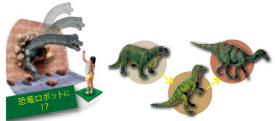
恐竜ロボットによる餌やり体験

恐竜ロボットによる餌やり体験や発掘体験など、楽しく学べるコーナーも！ また、特別展会場内は写真撮影が可能です。