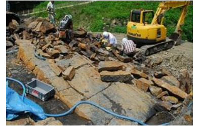
恐竜化石の発掘現場（福井県勝山市）

本展では、この「復元」をテーマに太古の昔、6600万年以上前の地球に実在した恐竜たちの姿に迫ります。