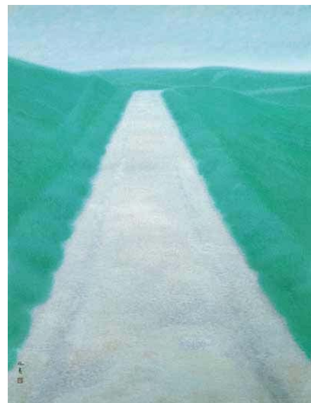
《道》 1950年 東京国立近代美術館蔵

この章では、模索の時期を経てたどり着いた東山芸術の出発点と、「青の画家」のイメージを伝える北欧の風景画をご紹介します。