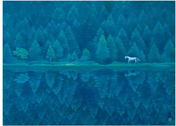
《緑響く》 1982年 長野県信濃美術館 東山魁夷館蔵

この章では、西と東の古都の情景とともに、ドイツ・オーストリアから帰国した後に生み出した「白い馬の見える風景」の連作もあわせてご紹介します。