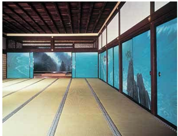
「唐招提寺御影堂内部」

律宗の総本山である奈良・唐招提寺。御影堂は、開祖・鑑真和上の御像を祀ります。奈良時代、苦難を乗り越えて日本に戒律を伝えた和上に捧げる障壁画を、東山はおおよそ十年の歳月をかけて完成させました。第一期(1975年完成)は、日本各地を取材してまとめ上げた幽玄な山容と波打ち寄せる広大な海を、上段の間と宸殿の間に絵画化。第二期(1980年完成)は、和上の故国・中国への取材を重ね、厨子の配される松の間と、両隣の桜の間、梅の間に、和上の郷里・揚州と、中国の名勝として知られる黄山と桂林の情景をそれぞれ水墨画で描きました。会場では、御影堂での展示状態を可能な限り再現し、画業の集大成というべき畢生の大作をご紹介します。