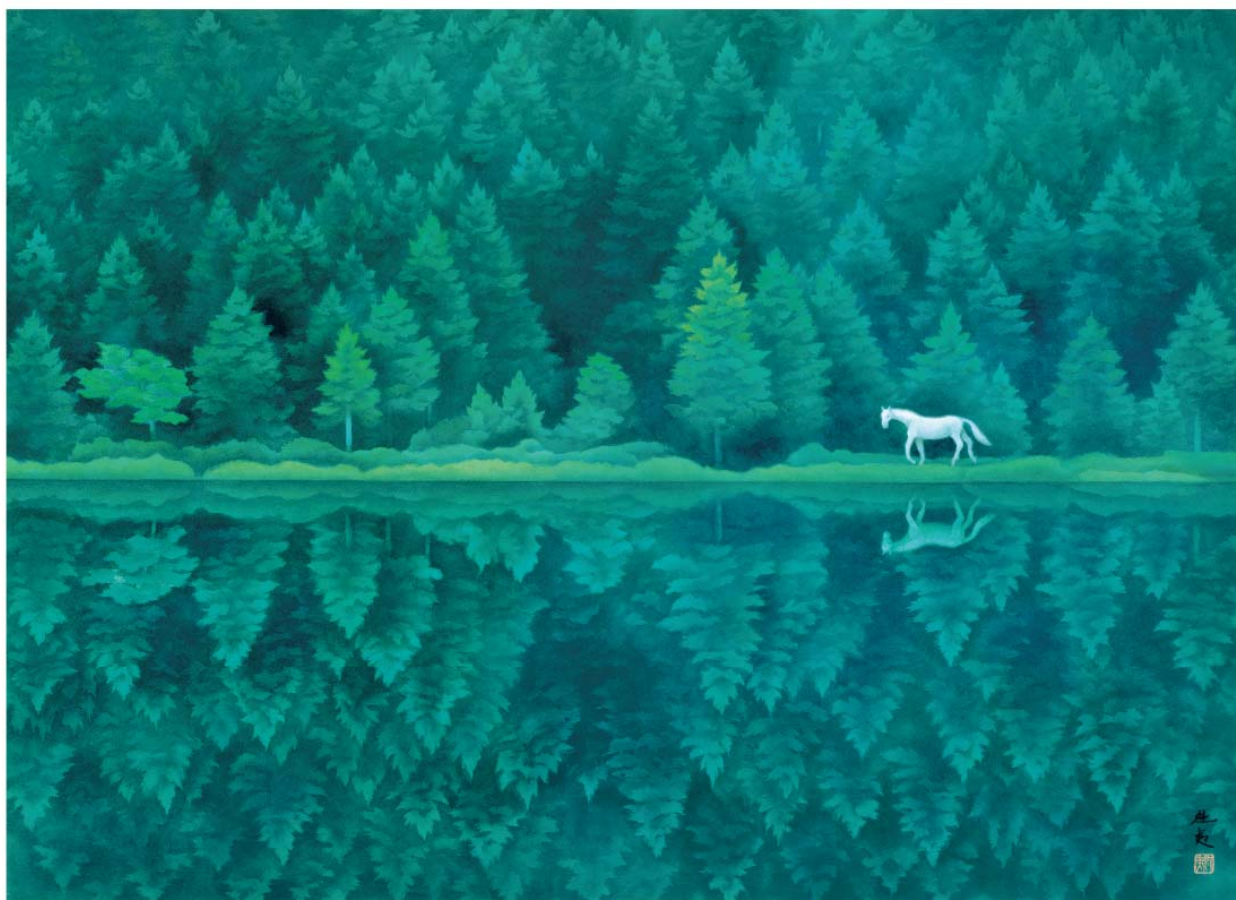
＜緑響く＞ 1982年 長野県信濃美術館 東山魁夷館蔵