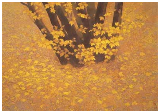
《行く秋》 1990年 長野県信濃美術館 東山魁夷館蔵

この章では、唐招提寺御影堂障壁画以降の仕事から絶筆となった作品まで、旅を愛した画家の終わりのない探求の旅をご紹介します。時の流れのなかで自然が見せる生命感を確かに捉えたその作品は、移ろい変化するものこそが生であると考え、その輝きを描き続けた東山の一貫した作画姿勢を伝えています。