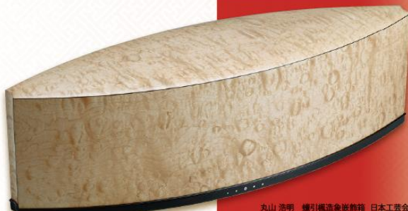
丸山 浩明 楳引風流金炭約箱 日本工芸会総裁賞