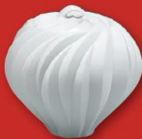
高橋 奈己 白磁水指 日本工芸会新人賞