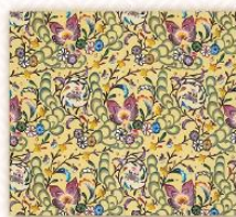
城間 栄順 琉球紅型染着物「彩海」(部分) 日本工芸会奨励賞