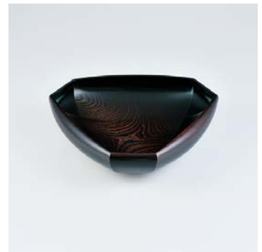
川口清三 櫻拭漆鉢 日本工芸会保持者賞