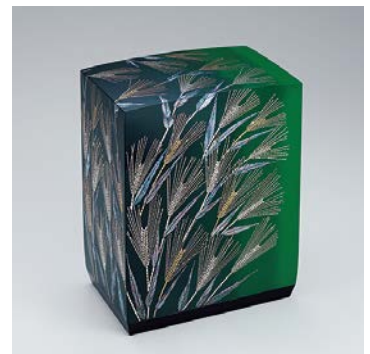
金城一國斎 切金螺鈿箱「青麦」 朝日新聞社賞