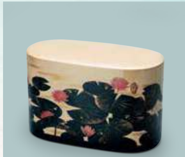
田中 義光《蒔絵箱「盛夏」》日本工芸会奨励賞

The 71st Japan Traditional Kōgei - Art Crafts - Exhibition