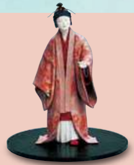
満丸 正人《木芯桐塑和紙貼「あかばな」》高松宮記念賞